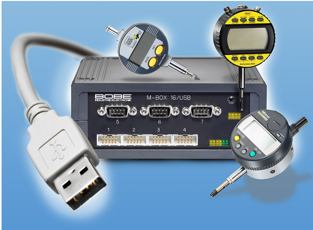
z.B. M-Box 16 USB