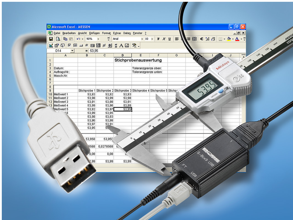
z.B. S-Box 9 USB