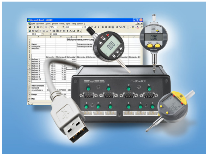
z.B. T-Box 405USB